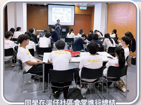
同學在灣仔社區會堂進行總結

本校中五級地理科同學參加灣仔實地考察。同學透過觀察灣仔一帶的土地利用變化，了解市區更新與城市環境的關係、認識市區更新的不同措施及評估市區更新如何改善環境。實地考察讓同學以蒐集數據方法評估城市環境，利用數據繪製圖表以展示市區更新能否達致城市可持續發展，從而讓同學關注因城市發展所引起的問題，培養保護和改善城市環境的責任感。考察期間，同學表現積極，認真學習，盡力把課堂所學實踐出來。