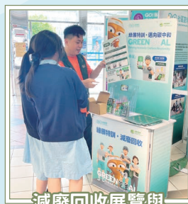
減廢回收展覽與攤位遊戲