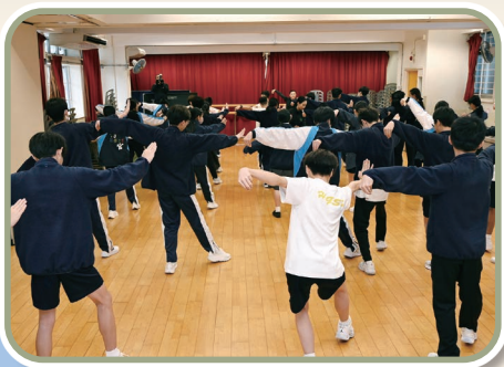
同學展現武術動作的功架