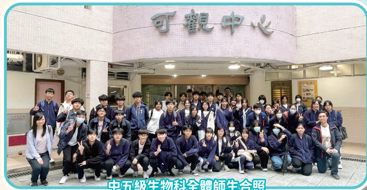
中五級生物科全體師生合照