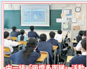
中一級「吸煙多面睇」活動