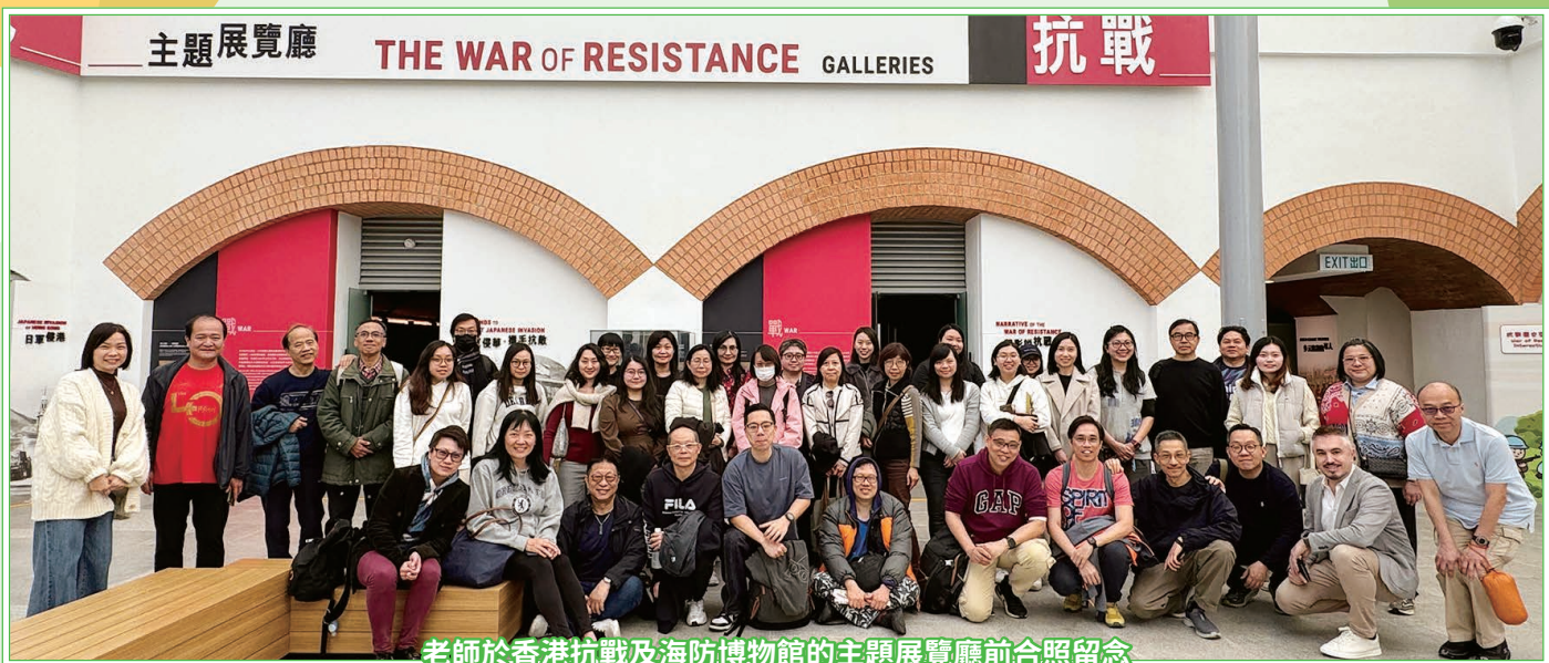
老師於香港抗戰及海防博物館的主題展覽廳前合照留念