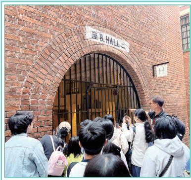
參觀香港從前的監獄環境