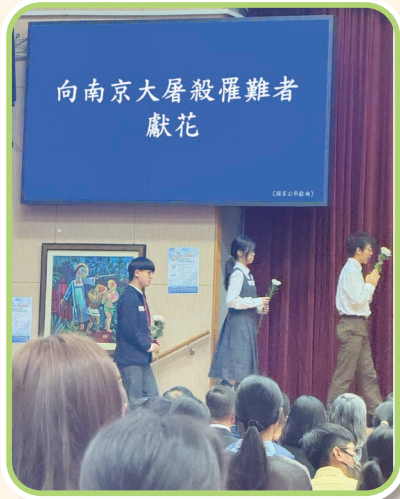
學生代表在悼念南京大屠殺活動上為罹難者獻花