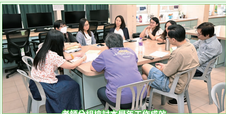
老師分組檢討本學年工作成效