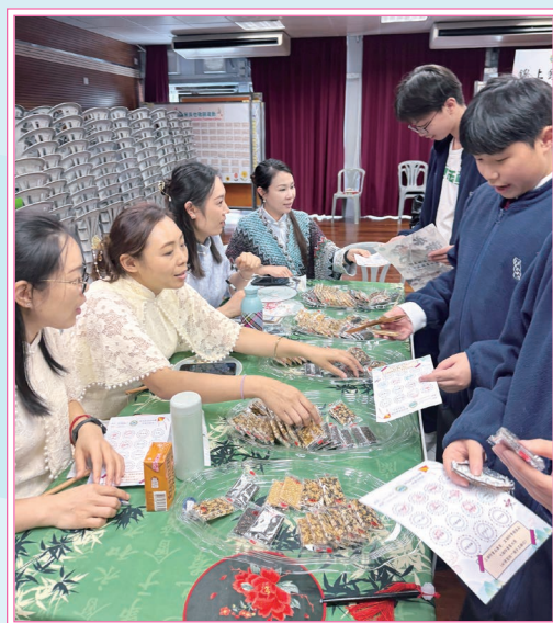
家長穿上華服派發傳統小吃