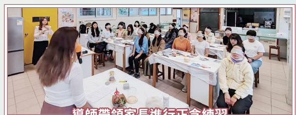
導師帶領家長進行正念練習