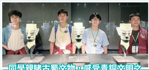
同學親睹古蜀文物，感受青銅文明之神秘與震撼