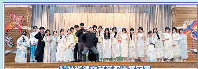
智社獲得穿著華服比賽冠軍

本校德育及公民教育組聯同中文科、中文學會及普通話學會，合辦了中華文化日。當日同時舉辦四社華服穿着比賽，社員在社長帶領下踴躍參與，穿上華服投入活動，呈現出濃厚的傳統文化氛圍。比賽結果，智社榮獲冠軍，德社取得亞軍。