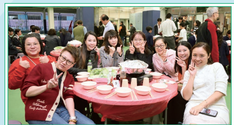
謝副校長、鄭副校長與一眾家長合照