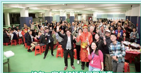
校友、家長和師生同賀迎春

切燒豬儀式乃晚宴壓軸環節，配合緊張刺激的問答及抽獎遊戲，將氣氛推向高潮，歡呼聲此起彼落，眾人盡興投入，度過了一個溫馨愉快的晚上。