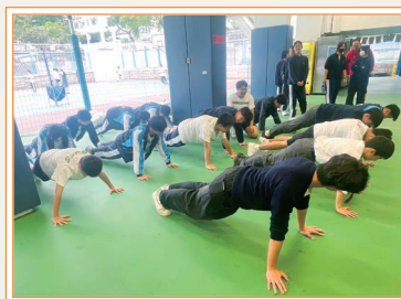
同學全力以赴，接受體能挑戰