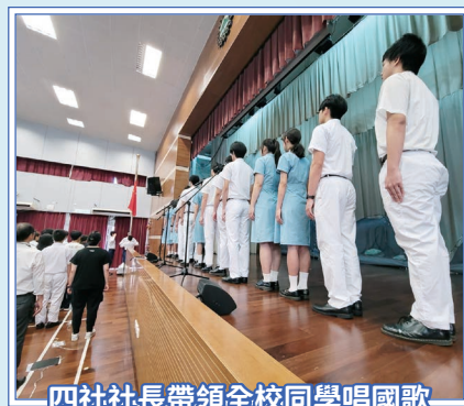
四社社長帶領全校同學唱國歌

四社亦與訓導組合作舉辦社際守時守規比賽，藉此培養同學的自律精神。在試後活動期間，更安排了四社中文辯論比賽、普通話歌詞創作比賽及問答比賽，冀透過多元化的競賽，為同學提供展現才能的平台，提升語文素養、慎思明辨及團隊合作的能力。