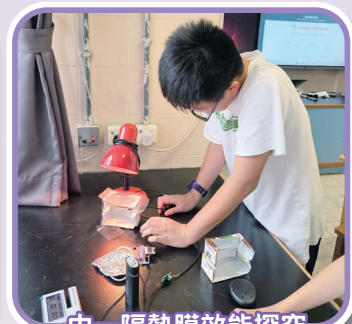
中一隔熱膜效能探究

榮登中二級最受歡迎活動榜首的「起橋設計及製作比賽」是由物理科及環保教育組合辦。同學們在班房內全神貫注，靈活運用物理學結構與環保概念建構橋樑，其專注與投入的態度令人讚賞。此外，同學亦參與了四個具啟發性的「STEAM 小組工作坊」，包括懸空結構、密碼學、指紋鑑證及陀螺王工作坊，在動手實作中吸收了多元的科技知識。