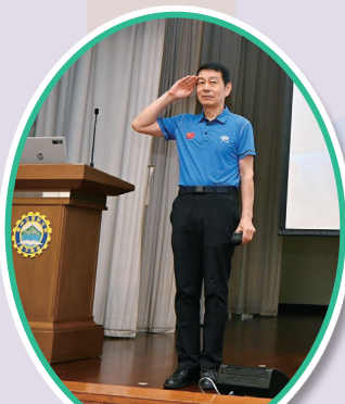
航天專家趙傳東為同學 介紹中國航天科技發展

本週最吸引同學的焦點活動，莫過於星期三於禮堂舉行的「中國航天科技講座」。本校非常榮幸邀請到中國首批太空人、原空軍一級飛行員及航天專家——趙傳東先生親臨主講，題目為「中國航天員是怎樣煉成的」。趙專家曾參與神舟五號至神舟十號飛行任務的相關訓練，他生動地向中一至中五級同學分享了太空人極具挑戰性的訓練歷程與科研管理經驗。活動中，同學雀躍地向專家發問，大大擴闊了同學的航天科技與科普視野。