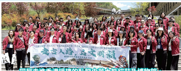
同學走進香港援建的臥龍中華大熊貓苑及博物館，親身體會深厚的民族情誼