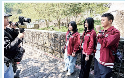
同學在臥龍中華大熊貓苑拍攝短片，介紹愛護大熊貓，傳承保育的理念