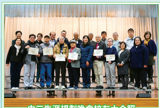
中三生涯規劃晚會校友大合照

此外，中三級的生涯規劃晚會已於1月23日順利舉行，當晚校友分成13組，與中三級全級同學分享選科心得，並細說自己在母校的軼事。另一方面，本組亦積極安排中四及中五級同學參與由教育局「商校伙伴合作計劃」舉辦的各類型行業體驗活動，每項活動為期一至三天。根據問卷調查結果，同學普遍認為這些活動有助他們規劃未來的升學及就業路向，並加深了解日常工作常規及實際職場環境。