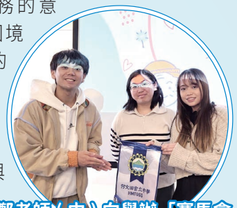
鄭老師(中)向舉辦「賽馬會眾心行善——義工推廣校園夥伴計劃」的機構致送錦旗

本組安排中一級同學參與賽馬會眾心行善——義工推廣校園夥伴計劃。透過真實個案，讓同學認識義工服務的意義、了解獨居長者困境及人口老化對社會的影響。同學亦需在課餘完成「小善幸」任務，記錄幫助長者的行動，培養同理心與關心社會的精神。