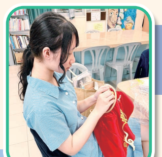
學生親手製作自己設計的裙褂