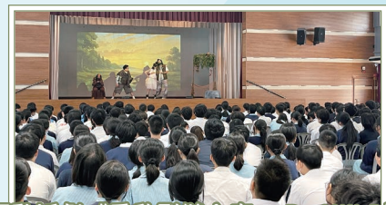
互動話劇《重啟裂縫之森：Re-WILD》