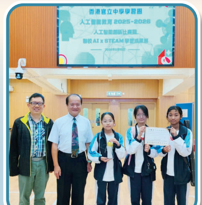
官校AI創新比賽得獎同學與羅副校長合照