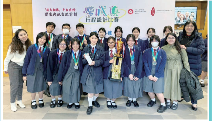
同學榮獲「夢成真」行程設計比賽（初中組）季軍及兩項優異獎