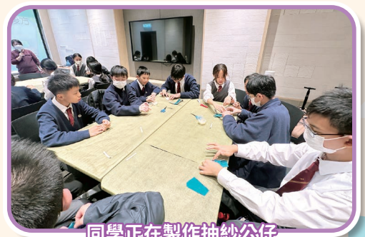
同學正在製作抽紗公仔