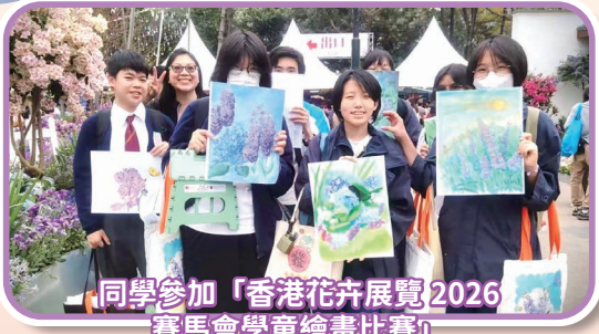
同學參加「香港花卉展覽2026賽馬會學童繪畫比賽」

修讀視藝科的中五級同學於3月20日參加「香港花卉展覽2026賽馬會學童繪畫比賽」，以「紫羅蘭」為主題進行戶外寫生，展現專注投入的態度，作品獲參觀者高度讚賞。