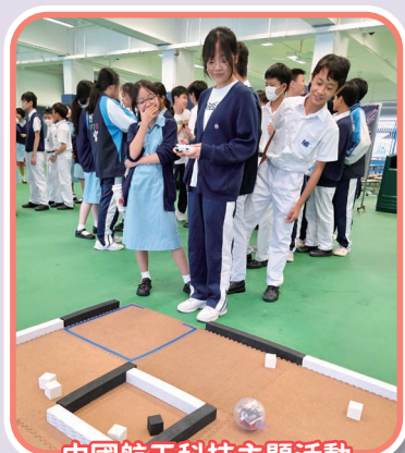
中國航天科技主題活動