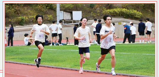
男子甲組 1500 米比賽，同學全力爭勝