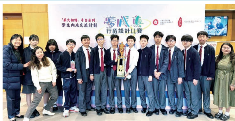
同學榮獲「夢成真」行程設計比賽（高中組）季軍及兩項優異獎

五天的行程讓同學看遍古蜀文明與現代成都，學到歷史文化、生態保育等知識，增強了文化自信與家國情懷。