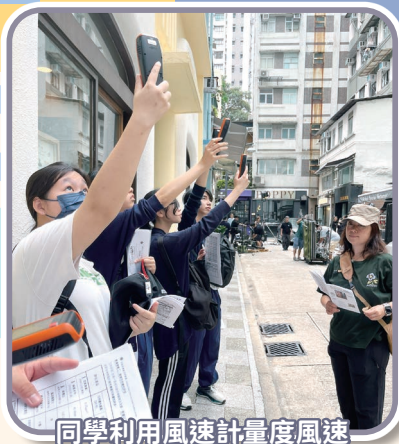
同學利用風速計量度風速

本校中五級地理科同學參加灣仔實地考察。同學透過觀察灣仔一帶的土地利用變化，了解市區更新與城市環境的關係、認識市區更新的不同措施及評估市區更新如何改善環境。實地考察讓同學以蒐集數據方法評估城市環境，利用數據繪製圖表以展示市區更新能否達致城市可持續發展，從而讓同學關注因城市發展所引起的問題，培養保護和改善城市環境的責任感。考察期間，同學表現積極，認真學習，盡力把課堂所學實踐出來。