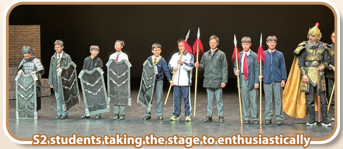
S2 students taking the stage to enthusiastically reenact scenes from the drama

with S4 book-sharing sessions and S5 inter-class competitions like "Broken Telephone" to boost active listening.