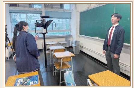
「健康學生演說大賽 2526」短片攝製

除校外參賽交流，辯論隊亦鼓勵隊員走出賽場，提名同學出任校外辯論賽主持、主席等崗位，累積活動策劃與執行的經驗；同時積極策劃校內試後活動「社際辯論賽」，推動全校辯論風氣。