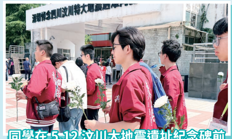
同學在5.12汶川大地震遺址紀念碑前獻上鮮花，悼念在大地震中罹難的同胞