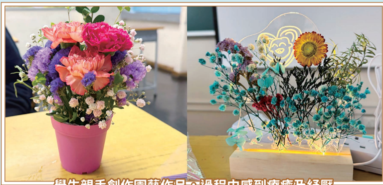
學生親手創作園藝作品，過程中感到療癒及紓壓