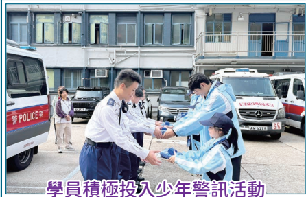
學員積極投入少年警訊活動