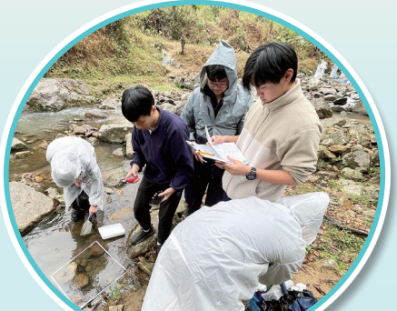
置身河岸生境，認真觀察生物，並記錄各項環境數據

專業儀器測量多項非生物因素，並為收集到的水樣本進行化學測試，實踐科學探究精神。這次考察讓同學走出課室，將書本上的生態學知識活學活用於香港的天然生境中，親身體會大自然的奧妙。