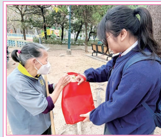
同學向默默耕耘的清潔工人送上新春福袋

農曆新年前夕，本組參加香港青年協會「有心計劃——愛心送暖行動」。20 位同學走上街頭，向默默為社區付出的清潔工人送上新春福袋，表達感謝和敬佩之情，並傳遞節日溫暖與關懷。