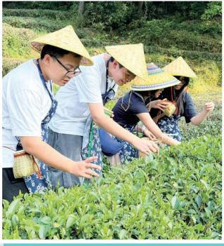
龍井茶園裡，同學們親手體驗採茶的樂趣

本校 15 位獲獎同學於 5 月 11 日至 15 日展開「解碼杭州，穿越古今」交流之旅。行程圍繞「數位科技與傳統文化融合」的主題，同學先後參訪阿里巴巴園區、文三數字生活街區及杭州樹人榜億電競學院，親身體驗電競比賽及人工智能產品，深入認識人工智能與雲計算的尖端發展；同時走訪梅家塢龍井茶園、西湖風景區及烏鎮，體驗炒茶工藝、藍印花布扎染等非物質文化遺產。同學更與教育局局長蔡若蓮博士一同於印象西湖演出劇場觀賞《最憶是杭州》科技表演。透過實地考察及欣賞表演，同學不僅領悟國家數字科技的創新，更深切感受中華文化的厚度，達成將科技與文化傳承融會貫通的學習目標。