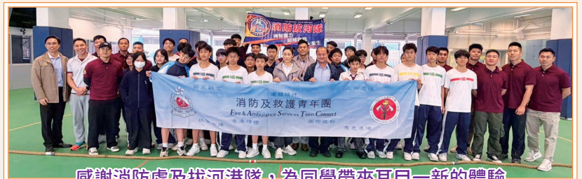
感謝消防處及拔河港隊，為同學帶來耳目一新的體驗

本校期望透過多元化的課外活動，讓同學們走出課本、擴闊視野，更重要的是能在過程中鍛鍊體魄，建立起面對挑戰的強大自信心。