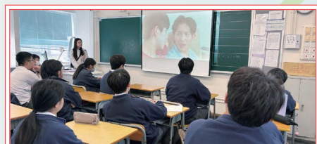
中三級「無藥一樣COOL」活動

本組推廣一系列與健康、生活及性教育相關的活動，旨在全方位守護學生的身心健康。本組鼓勵同學參與健康服務及接種流感疫苗，以建立有效的免疫屏障；同時為中六女生安排到校接種隊，進行最後一次HPV疫苗補種，提供長遠的健康保障。