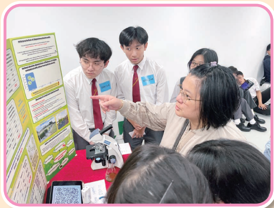
同學參加香港學生科學比賽