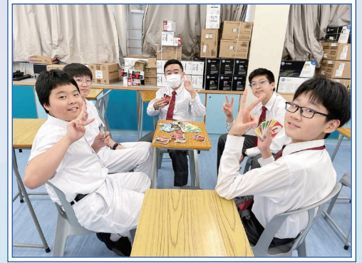
同學藉桌遊提升思維能力