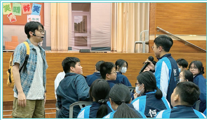
同學就劇中的欺凌事件表達感想