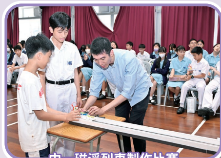
中一磁浮列車製作比賽