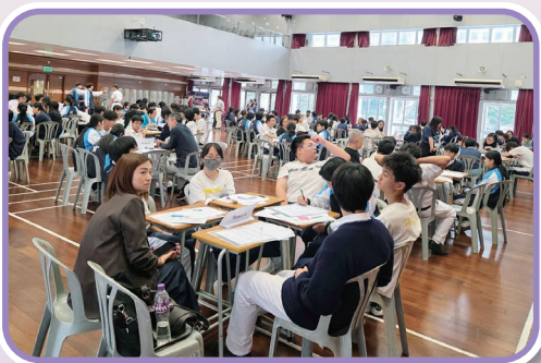
中三 JA 公益編程挑戰賽工作坊

中三同學參與了「JA 公益編程挑戰賽工作坊」，透過平板電腦學習編程技術，有效強化了運算思維與邏輯分析能力。同學亦參與了香港浸會大學物理系助理教授主講的 STEAM 講座，講題為「秩序與混沌之間：臨界性如何塑造自然與機器中的智能」，引導同學探討前沿的智能科學概念，成功拓闊跨學科視野。