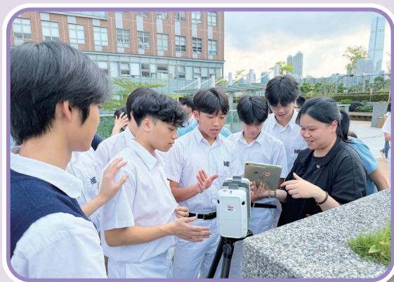
同學在香港理工大學試用智慧城市測量儀器

中五級同學的體驗充滿了高等科研與生涯規劃的元素。週二，全級同學出發前往香港理工大學參與智慧城市講座及實驗室參觀活動。同學分組深入多個頂尖科研實驗室，包括在 4D CAVE 中「解鎖香港二戰遺跡的秘密」、參與「測量設備演示」以及參觀「地下管線測量實驗室」，體驗高等科研環境並啟發升學規劃。週四，同學則在「JA 領袖對話講座」中，與稅務服務合夥人及人才管理助理總監進行交流，深入探討「AI + 金融」的未來趨勢與生涯規劃。週五，同學同樣在禮堂體驗了「人體姿勢估測應用程式」技術。