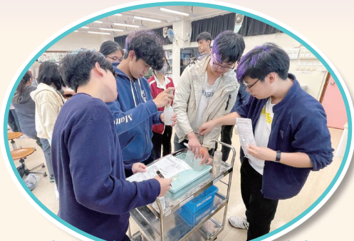
走進實驗室，親手進行化學測試