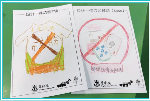
同學設計的抗賭宣傳單張

為培養學生明辨是非，並養成良好的生活習慣，本組於1月28日安排中一同學參加「抗賭攤位遊戲」，通過遊戲引導同學分辨日常生活中的「想要」和「需要」，並反思沉迷賭博的禍害，明白「以小博大」、「不勞而獲」的心態並不可取；本組又於3月4日安排中一至中五級同學觀賞以「防止校園欺凌」為主題的話劇，通過觀賞話劇，嘗試代入欺凌者、被欺凌者、旁觀者的角色，反思與人相處之道，學習如何理性處理人際衝突。