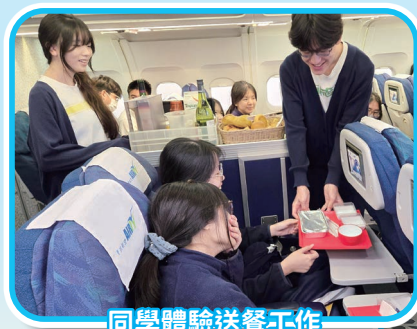
同學體驗送餐工作

此外，為配合行政長官《2024 年施政報告》開拓中東及東盟旅客市場，政府與業界積極推動香港成為「穆斯林友好」旅遊目的地。本科學生藉參觀九龍清真寺暨伊斯蘭中心，了解穆斯林的祈禱禮儀及生活需要，學習尊重與包容不同文化。