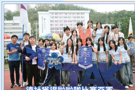
德社獲得啦啦隊比賽亞軍