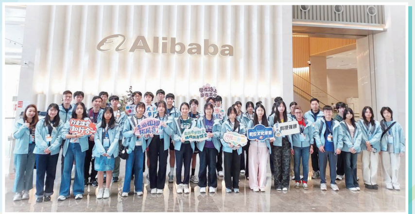
同學參訪阿里巴巴集團大樓，深入了解企業發展與創新科技

感謝教育局舉辦此行程設計比賽，讓同學走進祖國大地，成長為有擔當的新時代青年。本校將繼續推動同類活動，培育具國家視野的新一代。