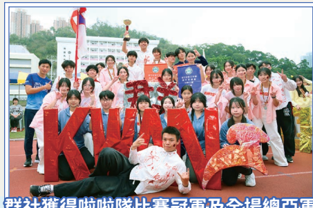
群社獲得啦啦隊比賽冠軍及全場總亞軍