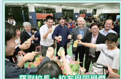
羅副校長、校友與同學們一同舉杯暢飲