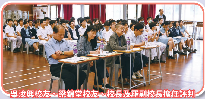
吳汝興校友、梁錦堂校友、校長及羅副校長擔任評判