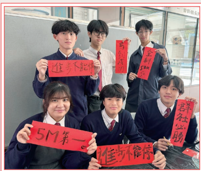
同學展示親手寫的揮春，寄托美好願望

在「表情符號猜成語」活動中，同學觀看現代表情符號，聯想對應的古典成語，過程中不時引發討論與笑聲。「揮春設計工作坊」聯同設計與科技學會舉辦，同學使用傳統毛筆書寫揮春，亦嘗試以 3D 切割技術製作的拓印進行創作，感受文化與科技的碰撞。「錯別字擲彩虹」考驗同學辨別正字的能力，參與者擲出銀幣，挑戰不同難度的題目。從歡呼與惋惜聲中可見同學的投入程度，活動有助糾正同學常見的錯別字。除此以外，本會亦聯同數學學會合辦「心中有數——數字成語攻防戰」，同學分組進行數字成語卡牌對戰，在攻防過程中運用不同的數字成語。活動中，同學又挑戰破解魯班鎖，感受傳承千年的傳統智慧。