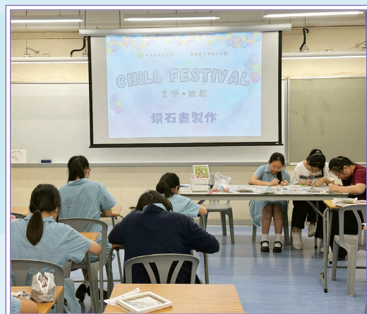
同學專心製作鑽石畫