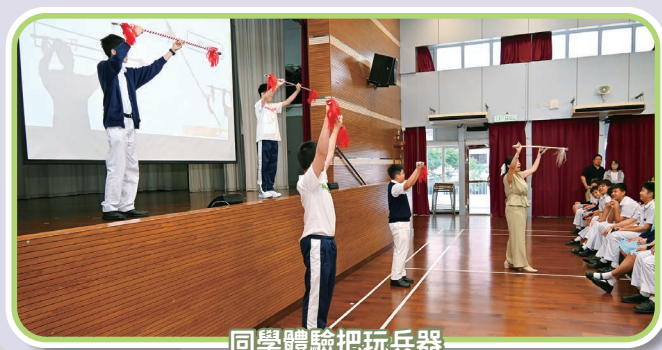
同學體驗把玩兵器

為弘揚中華傳統文化及豐富校園生活，中一至中三級全體同學參加了香港都會大學於5月13日在本校舉辦「粵劇四功五法」文化推廣工作坊。工作坊內容涵蓋粵劇歷史溯源及劇目賞析，導師深入淺出地講解了演員必備的「四功」（唱、念、做、打）與「五法」（手、眼、身、法、步）。活動設有互動環節，參加者嘗試以「官話」（戲曲發音）唱唸，並學習把玩兵器，親身體驗扮演武生。導師講解細緻，讓同學們體會到戲曲表演背後所需的功底與付出。