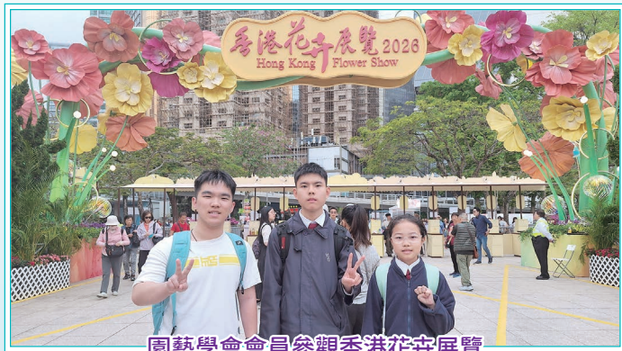
園藝學會會員參觀香港花卉展覽