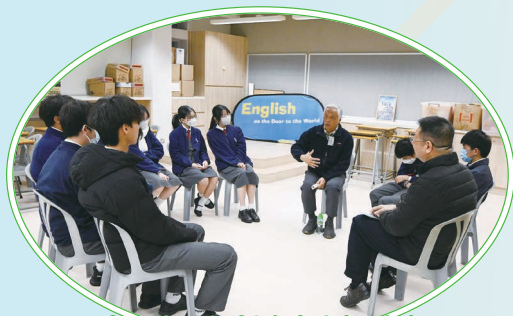
中三生涯規劃晚會小組討論

本組在下學期繼續舉辦各類型的大學、大專升學講座，以及各級的生涯規劃課，旨在幫助同學加深自我認識，了解不同院校的升學要求，並掌握各行各業的概況，從而讓同學為自己的生涯規劃做好準備。