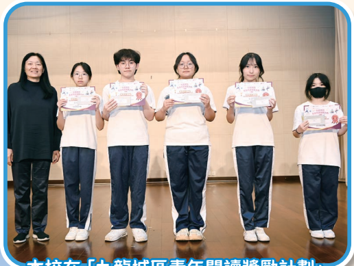
本校在「九龍城區青年閱讀獎勵計劃」 奪得優秀表現獎

同時，本科積極鼓勵學生參加不同類型的校外語文活動，例如校際朗誦節、「九龍城區青年閱讀獎勵計劃」及作文比賽等等，藉着與友校同學交流切磋，提升語文水平，發展潛能。