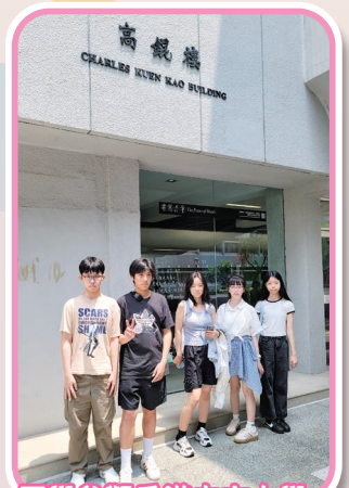
同學參觀香港中文大學，訪尋高錕教授的足跡