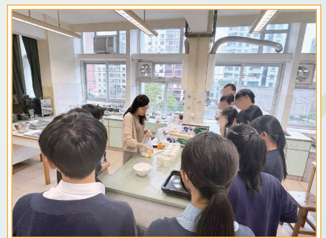
在家政科周老師的指導下，同學們學習製作「麻糬波波」