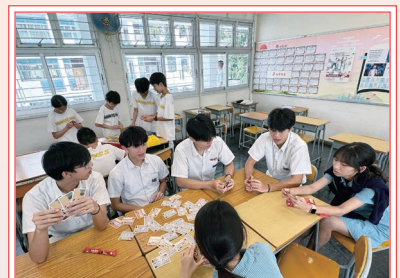
同學投入數字成語卡牌攻防戰

各項活動反應熱烈，同學不但提升了語文素養，亦體會到中華文化既深厚又活潑的一面。中文學會將繼續推陳出新，讓語文學習跳出課堂，走進生活。