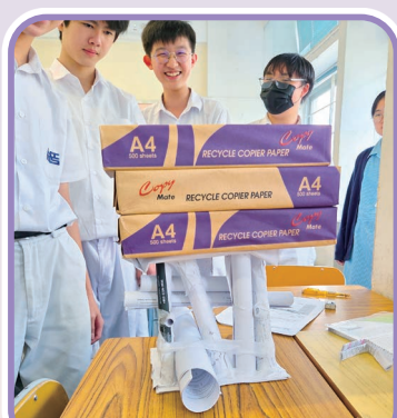
中二起橋設計及製作比賽

中一同學投入「磁浮列車比賽」，同學們在緊湊的比賽中盡展解難與團隊協作能力。同學亦透過「寵物小屋模型製作」活動進行科學探究，了解隔熱膜的效能。