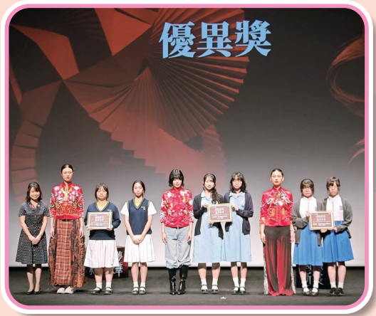
全港中學新中式裙褂設計比賽頒獎禮上，模特兒陪同獲獎同學接受獎項

頒獎禮已於5月23日舉行，參賽作品由香港知專設計學院學生穿上，並在時裝舞台上展示。作品在台上展現傳統韻味，加上現代美學元素，散發出時代氣息。