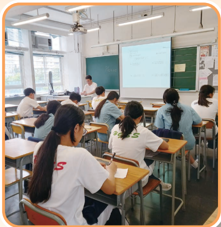
午間初中「試後跟進班」