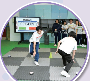
中四 STEAM 運動科學推廣體驗日班際比賽