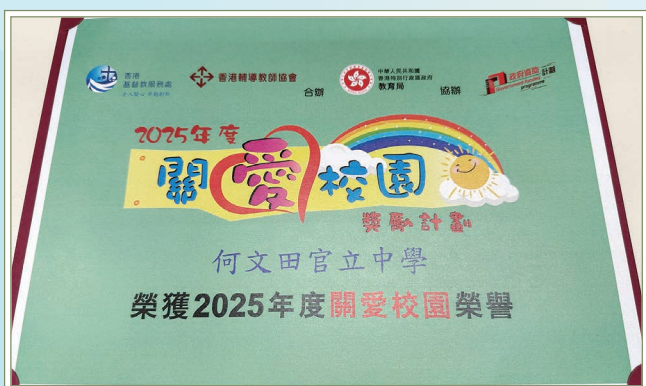
連續兩年於關愛校園獎勵計劃榮獲「關愛校園榮譽」

在校長及各副校長的帶領下，本校連續兩年於香港基督教服務處與香港輔導教師協會合辦的關愛校園獎勵計劃榮獲「關愛校園榮譽」。在各科組及持份者的努力下，建設一個關愛校園，實為同學之福。