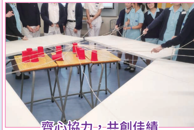
齊心協力，共創佳績