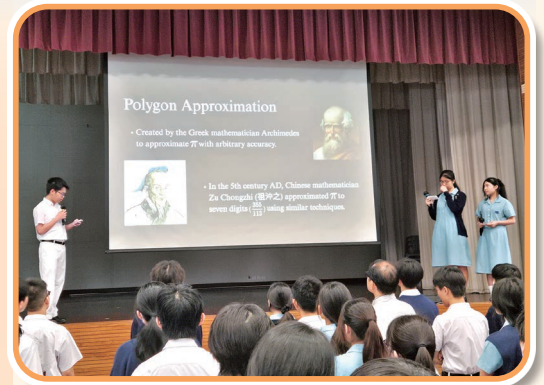
數學學會早會分享

在早會上，數學學會以英語向全校師生介紹《The Derivation of \pi 》，讓同學了解中國數學家在當中的貢獻。