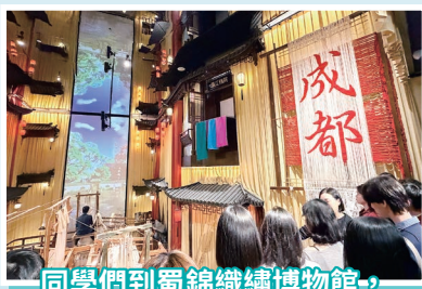
同學們到蜀錦織繡博物館，親身體驗織繡技藝