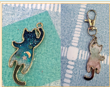
「友伴 Fun 享」：滴膠鎖匙扣創作活動同學成品

本組舉辦了不同的興趣體驗活動，當中包括雪花酥製作、滴膠鎖匙扣及麻糬波波烘焙活動。同學與朋輩交流中互相協助，建立正面的支援網絡及提升溝通能力。同時，透過親手創作，協助同學發掘個人興趣，提升其正面情緒。