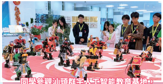
同學參觀汕頭群宇人工智能教育基地，欣賞英歌舞機器人表演