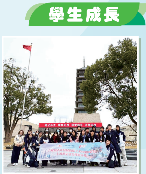
同學於上海淞滬抗戰紀念館前拍照留念