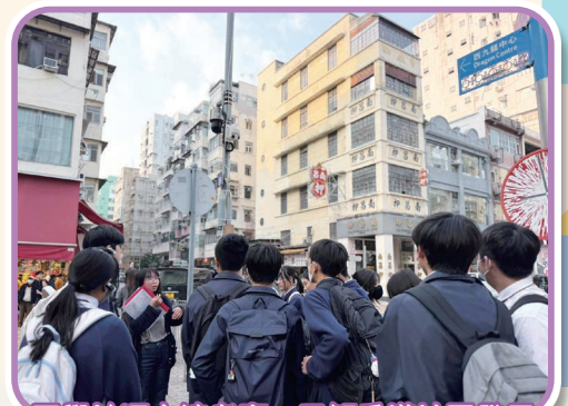
同學於深水埗考察，了解香港社區發展