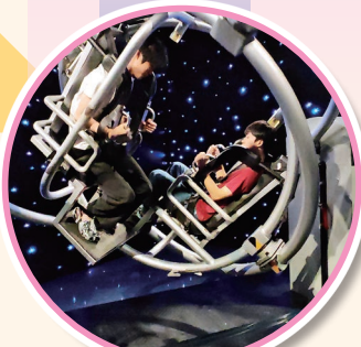
同學親身體驗科技的奧妙