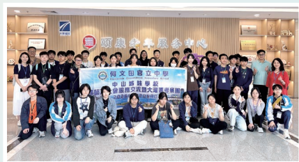
同學到中山頤康老年服務中心 探訪及表演