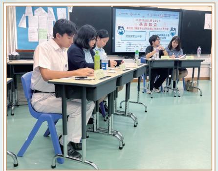
同學在「馮壽如盃」中表現出色