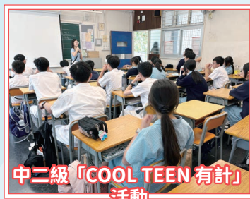
中二級「COOL TEEN 有計」活動

在成癮預防方面，本組安排導師為同學主講「吸煙多面睇」講座，深入剖析吸煙的害處；並結合「COOL TEEN 有計」及「無藥一樣Cool」等活動，強化同學拒絕毒品誘惑及濫用藥物的技巧。