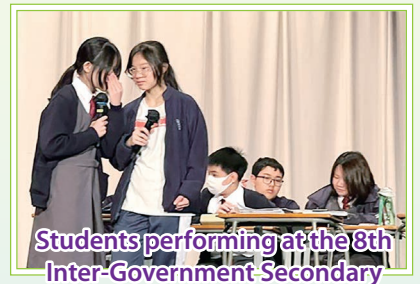
Students performing at the 8th Inter-Government Secondary School Drama Fest