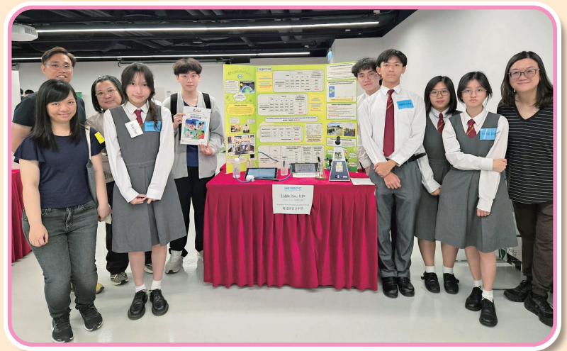
師生與參賽作品合照