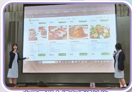
中三同學介紹自行設計的「拯救饑餓計劃」應用程式