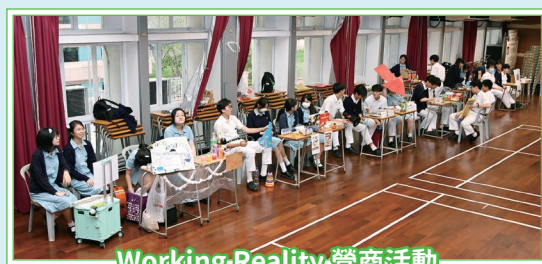
Working Reality 營商活動