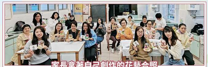
家長拿著自己創作的花藝合照

活動開始，導師先請家長選取一張圖片，藉此分享彼此當下的狀態與心情，在交流中拉近距離。隨後，導師帶領家長進行正念練習，引導家長閉上雙眼、專注呼吸，逐步放鬆身體，有意識地放下日常積累的壓力與緊繃感。最後，家長在導師指導下投入花藝創作，於製作過程中沉澱思緒，感受內心平靜。