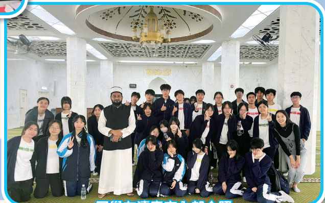
同學在清真寺內部合照