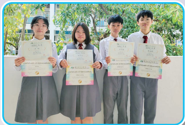
同學榮獲「Atec之星」殊榮