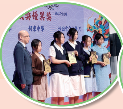
同學以「中國大熊貓與香港美食」為主題創作彩燈，榮獲「最佳藝術美感獎優異獎」

設計與科技科及視藝科主任帶領4位高中同學，參加「25/26 STEAM 中華彩燈設計比賽暨展覽」，以「中國大熊貓與香港美食」為主題創作，榮獲「最佳藝術美感獎優異獎」。作品於5月7日至9日在香港大會堂公開展出3天，同學即場向公眾解說創作理念，不僅展現跨學科思維，更加深了對中華文化的認同。