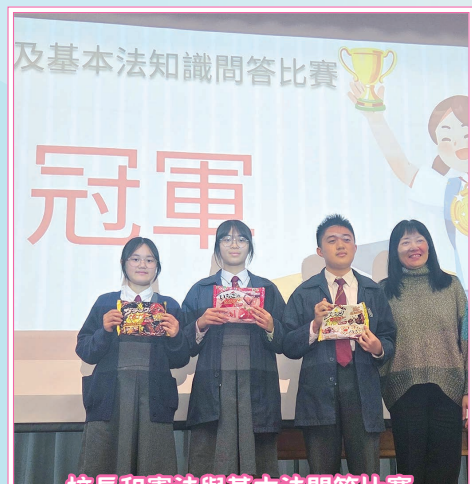
校長和憲法與基本法問答比賽冠軍隊伍合照

為深化同學對國家憲法及基本法的認識，本組分別為中二、中三同學舉辦「憲法與基本法問答比賽」。比賽中，同學透過觀看短片及問答比賽，逐步掌握相關知識。此活動有效提升同學對「一國兩制」及自身權利義務的理解，強化了法治意識及國民身份認同。此外，本組選派十多位中三及中四學生參加「基本法大使培訓計劃」，透過工作坊、講座及訓練營，深入理解《基本法》的精神及其在香港的重要性，並在生活中實踐公民責任。