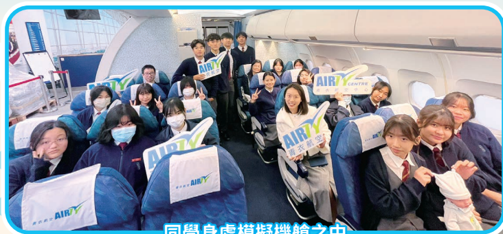
同學身處模擬機艙之中