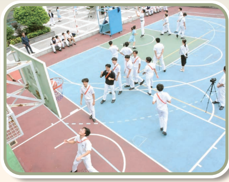
同學投籃後，隊員為他打氣