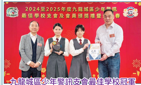
九龍城區少年警訊支會最佳學校冠軍