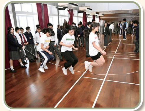
同學齊心協力跳大繩

本校於 2026 年 3 月 10 日首次參加由香港教育大學舉辦的「武術世界冠軍進校園」武術教育推廣計劃，旨在讓同學深入體驗中華文化體育項目，從而耳濡目染，體會武術的精神。本校 2H 班同學在導師悉心指導下，體驗武術的基本動作和當中的理念。