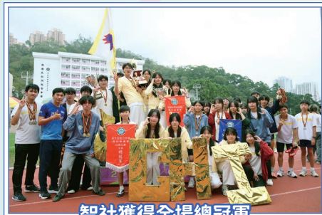
智社獲得全場總冠軍

在下學期舉行的陸運會中，各社社長率領社員及啦啦隊全力作賽，既展現了團結協作的精神，也為現場營造出熱烈氣氛。活動不僅考驗同學的運動技能，更深化了彼此的團隊意識。最終，智社奪得全場總冠軍，群社獲亞軍；啦啦隊比賽方面，群社摘冠，德社奪亞。