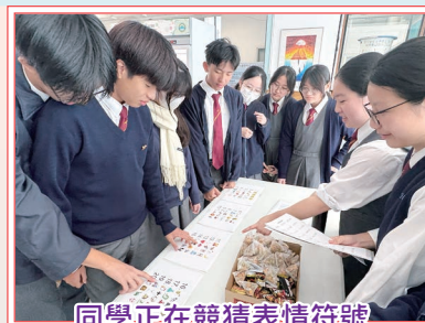
同學正在競猜表情符號所代表的成語