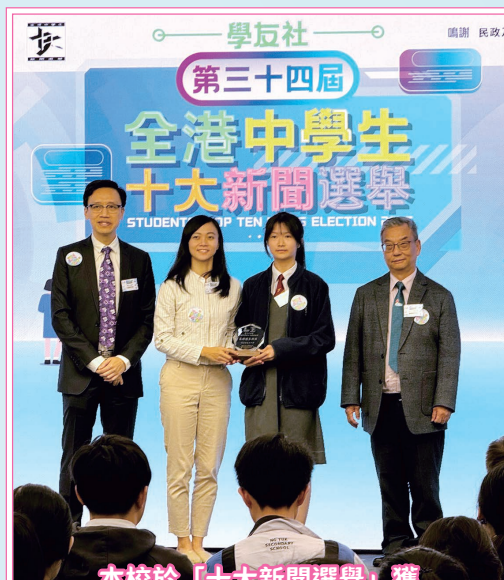
本校於「十大新聞選舉」獲「最踴躍參與獎」

總括而言，德育及公民教育組透過多元化的校內外活動及比賽，為同學提供廣闊的學習平台，增強他們對國家的認同與責任感，培養良好品德與領導才能，為全人發展奠定堅實基礎。