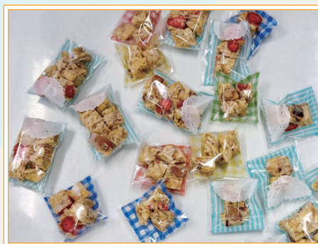
「雪花酥」烘焙活動中同學的製成品