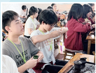
同學學習炒茶及品茶，深研茶藝