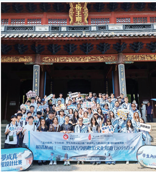
參觀杭州岳王廟，讓同學感受歷史人物的愛國精神