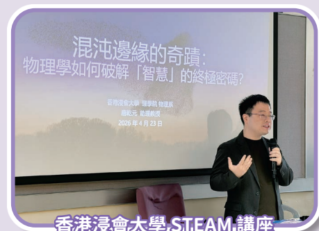
香港浸會大學 STEAM 講座

中四級同學的活動動靜皆宜。週一先由香港城市大學學務長帶來「化妝品增稠劑的奧秘」講座，講解科學知識在日常生活中的實際應用。週四的實地參觀更是焦點所在：38 位同學參觀環保地標 T·PARK（源·區）；56 位同學參觀中文大學賽馬會氣候變化博物館，深化生態安全意識；另外 33 位同學則走進香港科技园創科體驗館，親身體驗本港最新的創科成果技術。週五，同學亦在禮堂親身體驗了走在科技前沿的「人體姿勢估測應用程式」技術。