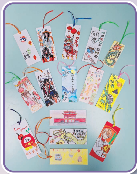
同學以「中華文化」及「STEM」為主題創作書籤

另外，圖書館參加了由香港創意閱讀教育協會主辦的「2025-2026 年度全港學生書籤交換計劃」，圖書館領袖生設計以「中華文化」及「STEM」為主題的書籤，與夥伴學校荔景天主教中學的同學進行書籤交換，共建分享及閱讀文化。