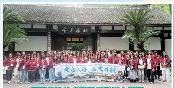
同學走進杜甫草堂感受詩人情懷