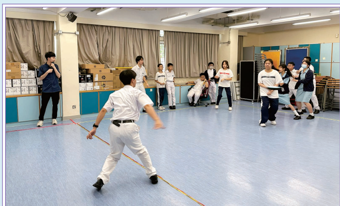
師生一起進行躲避盤運動

是項活動於5月26日至29日考試前舉行，藉此紓緩同學學習及考試的壓力。活動類別包含運動、藝術、解難等元素，師生一同放鬆心情，體驗4Rs精神健康的重要性。