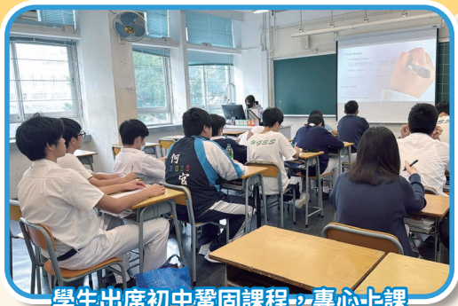
學生出席初中鞏固課程，專心上課