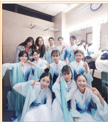
同學在比賽前的合照