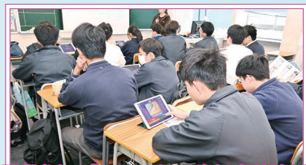
同學參加「IT-Prefect資訊素養培訓」