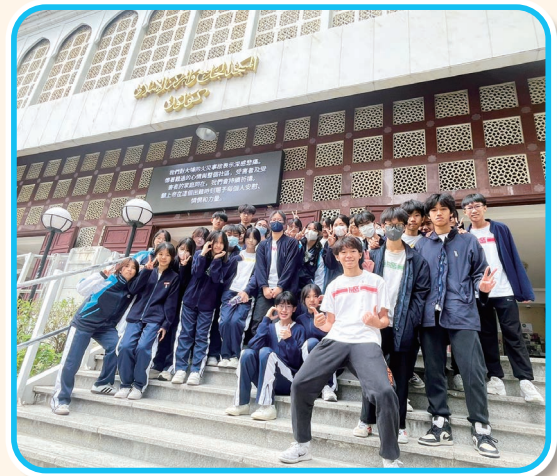
同學參觀全港最大的清真寺