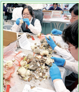
同學在水仙送暖迎新春工作坊中積極投入