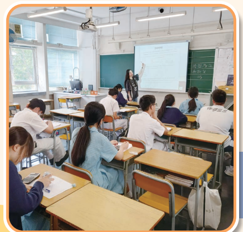
星期六初中數學鞏固課程