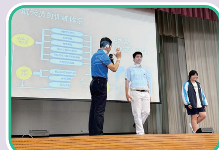
航天專家趙傳東細訴成為航天員的趣事