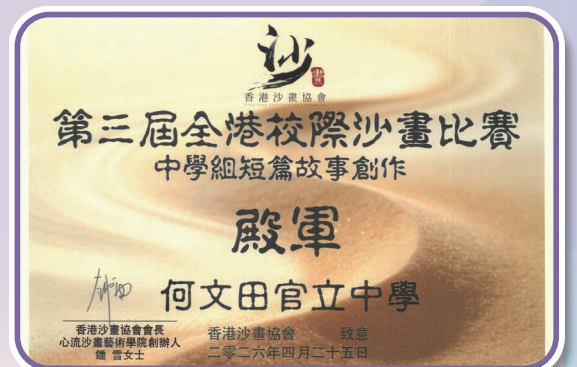
本校同學於沙畫比賽獲殿軍