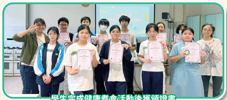
學生完成健康煮食活動後獲頒證書

此外，為提升同學對均衡飲食的認識，本校參與由香港中文大學健康教育及健康促進中心推行的「學生健康由煮起計劃」，合共完成七次健康煮食活動。同學們一同製作健康菜式，從中體驗健康烹調的樂趣。