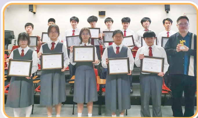
木笛隊參賽隊員及指揮合照