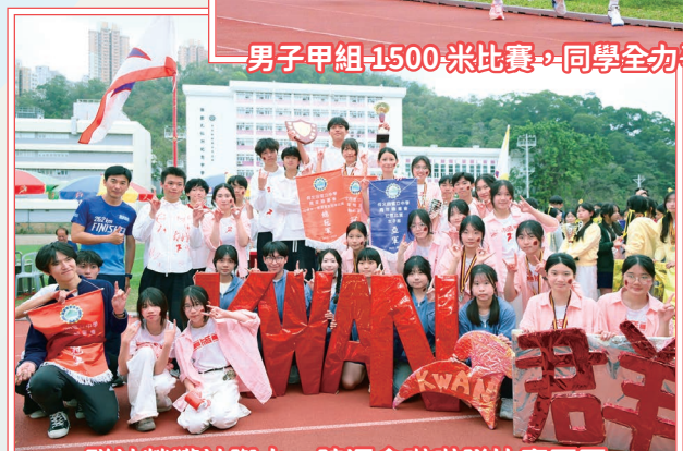
群社榮獲社際水、陸運會啦啦隊比賽冠軍