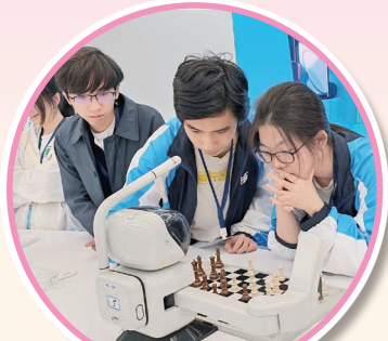
同學與電腦科技鬥智，破解棋局