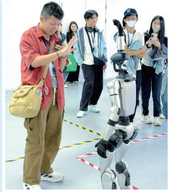
同學與機械人互動，體驗內地人工智能的尖端發展