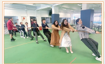
訓練有素的消防處職工與師生熱烈切磋，現場氣氛高漲