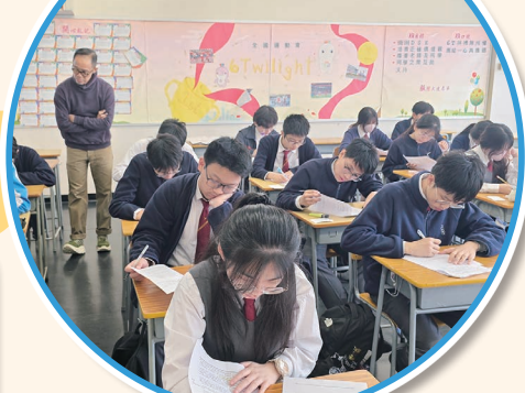
中四級同學在閱讀能力拔尖班上 努力提升理解能力