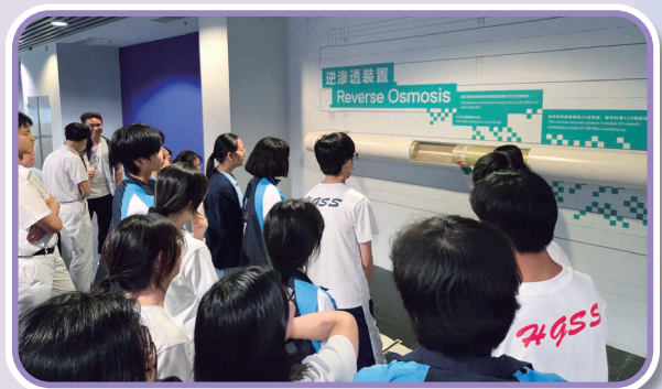
參觀 T·PARK 設施