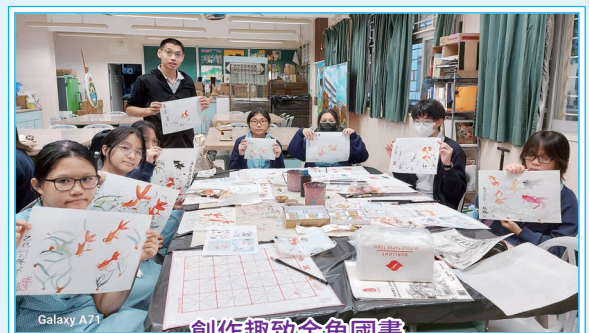
創作趣致金魚國畫