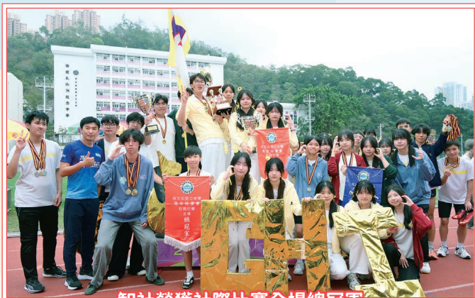
智社榮獲社際比賽全場總冠軍