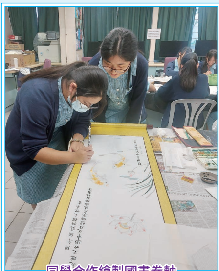
同學合作繪製國畫卷軸贈與頒獎嘉賓

書畫學會以「扎根傳統，陶冶性情」為核心目標，透過中國書畫創作，提升會員的書畫藝術技巧，深化對中華傳統文化的認識與欣賞，並在筆墨之間涵養靜心與專注的態度，達到以藝育人的效果。學會聘請資深校外專業導師親臨指導，教授同學繪畫花鳥蟲魚、小動物的技法，學習運用墨色乾濕濃淡，建構詩意構圖，又研習書法，創作賀年揮春，揮毫潑墨，帶領同學領略中國傳統藝術之美，感受中國書畫深厚的文化底蘊。