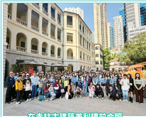
在赤柱古建築美利樓前合照