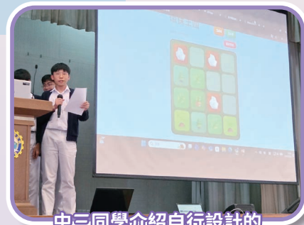
中三同學介紹自行設計的推廣環保應用程式

中四級同學的活動動靜皆宜。週一先由香港城市大學學務長帶來「化妝品增稠劑的奧秘」講座，講解科學知識在日常生活中的實際應用。週四的實地參觀更是焦點所在：38 位同學參觀環保地標 T·PARK（源·區）；56 位同學參觀中文大學賽馬會氣候變化博物館，深化生態安全意識；另外 33 位同學則走進香港科技园創科體驗館，親身體驗本港最新的創科成果技術。週五，同學亦在禮堂親身體驗了走在科技前沿的「人體姿勢估測應用程式」技術。