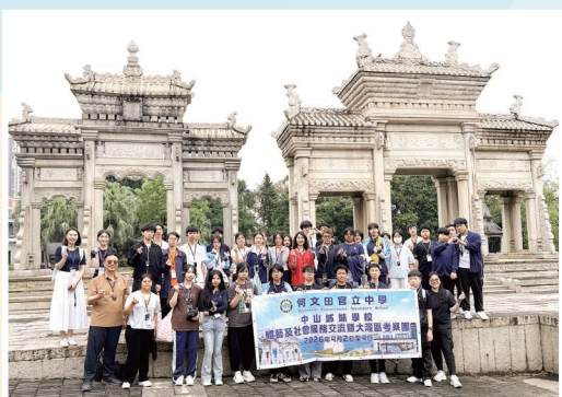
同學遊覽宏偉的梅溪牌坊，聽故事看古跡