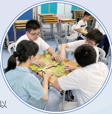
同學投入於遊戲當中

本會收集了多種不同類型的桌上遊戲，包括各類棋類、大富翁、Scrabble、UNO、Rummikub 等，供同學遊玩。此外，本會亦引入具教育意義的桌上遊戲，例如以國安教育為主題的「龍城遊歷學國安」、以生命教育為主題的「特種保衛隊」、以網絡安全為主題的「守網聯盟遊戲卡」、以及以社區文化為主題的「步走龍城之旅」等。本學年本會共舉辦了 11 次集會，透過不同有益身心的桌上遊戲活動，既能鍛鍊同學的解難能力、思維能力和創造力，亦能培養同學的社交技巧，以及提昇同學情緒管理的能力。