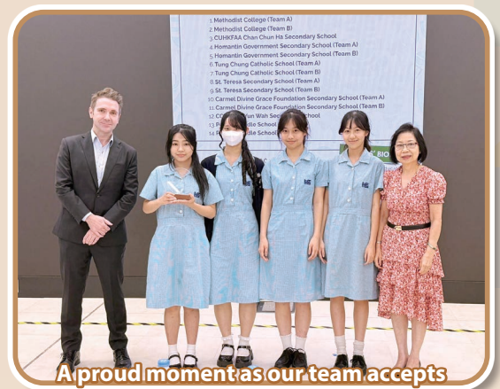
A proud moment as our team accepts their trophy at the territory-wide Time to Talk Competition