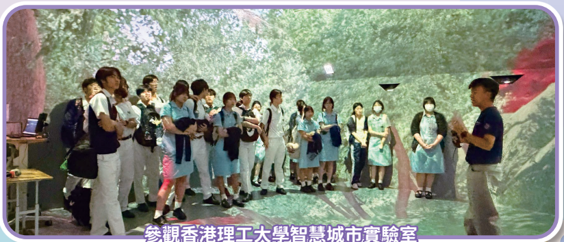
參觀香港理工大學智慧城市實驗室

中五級同學的體驗充滿了高等科研與生涯規劃的元素。週二，全級同學出發前往香港理工大學參與智慧城市講座及實驗室參觀活動。同學分組深入多個頂尖科研實驗室，包括在 4D CAVE 中「解鎖香港二戰遺跡的秘密」、參與「測量設備演示」以及參觀「地下管線測量實驗室」，體驗高等科研環境並啟發升學規劃。週四，同學則在「JA 領袖對話講座」中，與稅務服務合夥人及人才管理助理總監進行交流，深入探討「AI + 金融」的未來趨勢與生涯規劃。週五，同學同樣在禮堂體驗了「人體姿勢估測應用程式」技術。