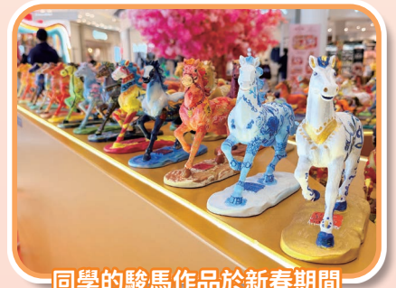
同學的駿馬作品於新春期間在奧海城商場展出

本校40位同學於新春期間參與奧海城舉辦的「奔馬藝術創作計劃」，從徐悲鴻大師的作品中汲取靈感，圍繞「堅毅、生命力」創作駿馬作品，與全港近700名學生的作品組成大型展覽，於新春期間展出，象徵藝術精神薪火相傳。