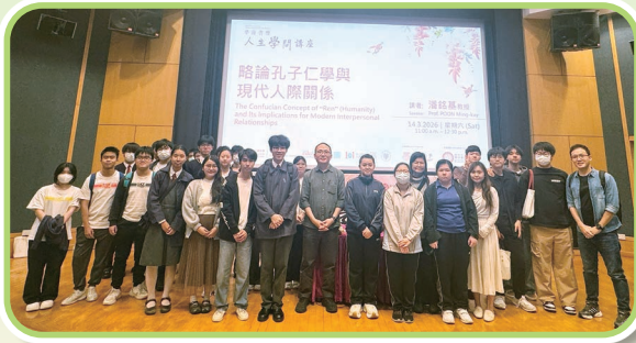
中四及中五級同學參加人生學問講座，與主講者合照

此外，本校中四及中五同學參加由香港公共圖書館與學海書樓合辦的人生學問講座：「略論孔子仁學與現代人際關係」。在講者潘銘基教授引導下，同學探討儒家核心思想「仁」於現代社會的應用，堅定文化自信。