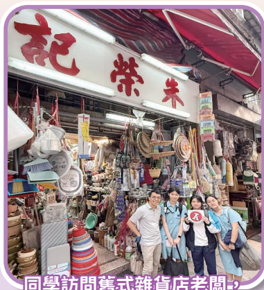
同學訪問舊式雜貨店老闆，了解香港工業發展

透過一系列活動，同學們不僅能走出課室、親身探索不同的社區，更加深了對本土歷史與文化遺產的認識，擴闊視野。