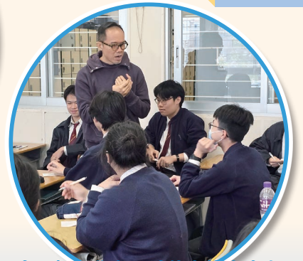
中五級同學在閱讀能力拔尖班上 積極回答問題