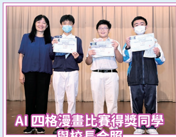
AI 四格漫畫比賽得獎同學與校長合照