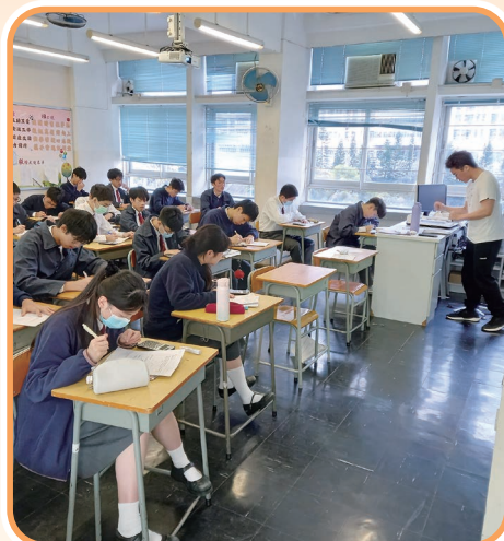
午間高中「精進研習班」