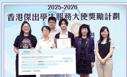
本校師生接受由國際扶輪3450地區頒發的支票，祝賀同學榮獲「香港傑出學生服務大使」優異獎