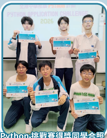
Python挑戰賽得獎同學合照

電腦科、資訊及通訊科技科除了在課堂上傳授基礎知識之外，也藉著課外活動、比賽等，引導同學瞭解電腦數碼科技的發展。尤其在人工智能日趨成熟完善之際，著力教導同學如何運用所學知識，鼓勵同學進行自我研習，希望同學日後能升讀心儀院校，投身社會，貢獻所長。