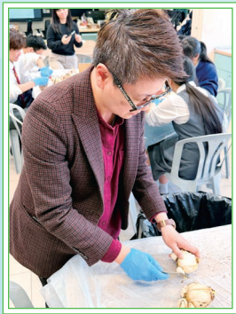
鄭副校長親自教導同學處理水仙頭