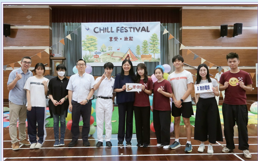
校長及一眾師生在 Chill Festival 享受、放鬆