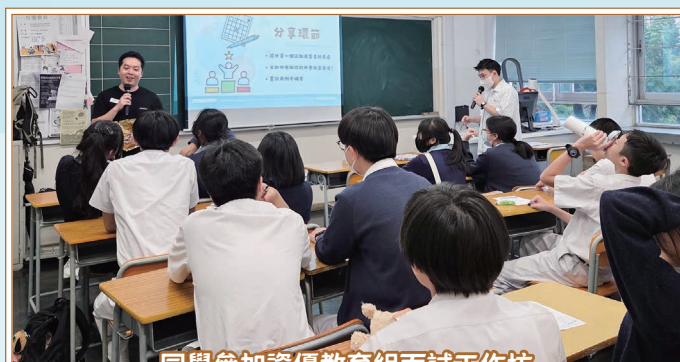
同學參加資優教育組面試工作坊

本校資優教育組於4月17日放學後，為19名中二至中四級成績及課外活動表現優異的同學舉辦「面試工作坊」，以提升同學的面試和表達技巧，裝備他們應付日後的面試。工作坊以有趣的互動形式，讓同學更認識自己的優點，引導同學整理其他學習經歷，教授同學面試時的注意事項和技巧。工作坊亦設模擬面試練習，讓同學把所學實踐並互相學習，以及教導同學如何處理面試時的心理壓力。透過是次工作坊，同學掌握了如何準備面試，亦加強了表達能力，更提升了面試的信心。