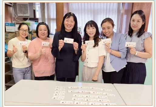
家教會準備咖啡券送贈給全校教職員

為響應「家長也敬師運動」，本校家長教師會今年精心準備了咖啡券，由校方於 6 月 8 日校務會議上代為送贈給全校教職員。家長教師會希望藉此衷心感謝老師們對學生的悉心教導，同時慰勞全體職員全年的辛勞與付出，攜手共建美好校園。