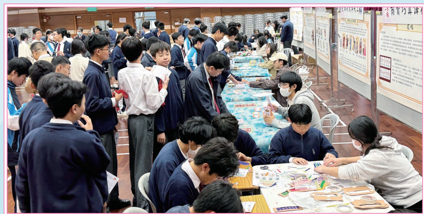
同學投入參與中華文化日活動