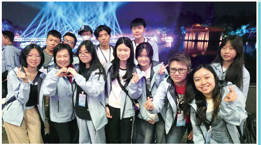
同學與教育局局長蔡若蓮博士於印象西湖演出劇場一同觀賞「最憶是杭州」表演