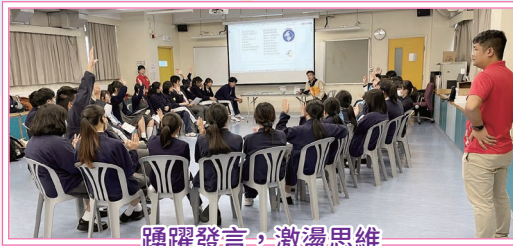
踴躍發言，激盪思維

為了加強學生領袖對領袖角色與責任的認識，並提升同學處理逆境及解決問題的能力，課外活動組早前為高年級學生領袖量身打造了「高級領袖技巧課程」。在兩天的工作坊中，同學全情投入，透過豐富多元的活動與討論，對領袖的角色與職責有了更深刻的體會。此外，本組亦為中三具潛質的同學舉辦了「中三領袖訓練工作坊」，讓同學在初中階段認識自我特質、提昇溝通技巧，裝備自己成為未來領袖。