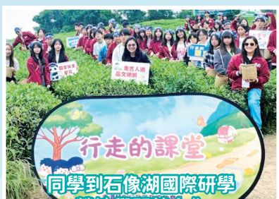
同學到石像湖國際研學營地學習茶文化