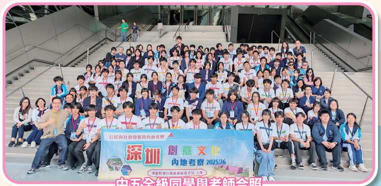
中五全級同學與老師合照