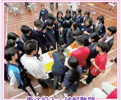
專注投入，破解難題