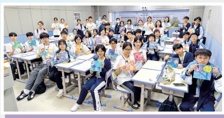
兩地學生攜手創作「以花傳情」主題 作品，並將成品送予中山頤康老年 服務中心的長者，傳遞關懷與祝福