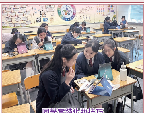
同學實踐化妝技巧