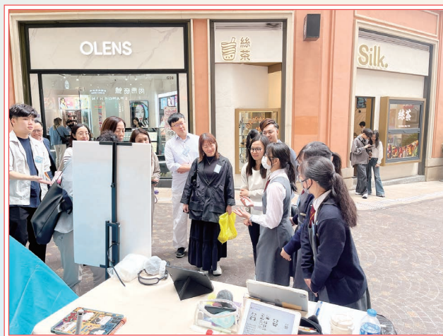
同學向來賓詳細解說攤位設計理念

為配合教育局推出的《4Rs 精神健康約章》，本校同學參與「樂繫校園獎勵計劃」中的中學生精神健康攤位比賽，榮獲「卓越表現獎」。決賽當日，同學於灣仔利東街展出攤位，表現積極熱情，留給公眾及嘉賓深刻而美好的印象。