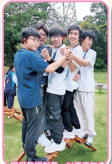
同學發揮創意，以平平無奇的木棒承載眾人的重量

這次行程將課本知識轉化為真實體驗，啟發同學以創意守護傳統、以科技擁抱未來，同時建立對國家發展更全面的認知，增強社會責任感。同學不再是被動的學習者，而是未來文化創新與城市建設的潛在參與者。