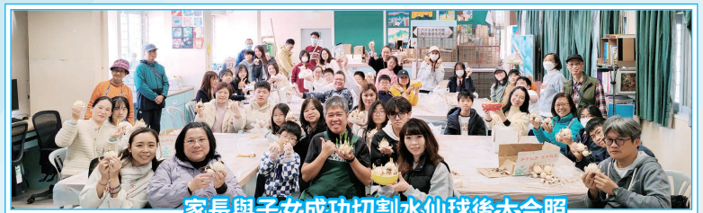
家長與子女成功切割水仙球後大合照

本會於 1 月 24 日舉辦「新春水仙花球培栽親子工作坊」，吸引了許多家庭踴躍參與。活動旨在讓親子共同學習水仙球切割與培植技巧，促進互動交流，迎接新春佳節。當日由專業導師逐步指導切割與養護水仙球的步驟。現場氣氛熱烈，家長與子女攜手合作，成功切割了多個水仙球，更自備環保容器帶回家中繼續栽培。另外，副校長、家教會主席、副主席、家長及教師委員均有到場支持，體現家校合作的精神。活動不僅加深親子情誼，亦讓同學感受傳統節慶文化的趣味。