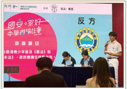
同學參加「國安·家好」中學辯論比賽