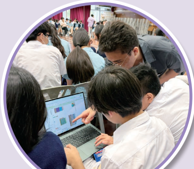
同學製作人體姿勢估測應用程式