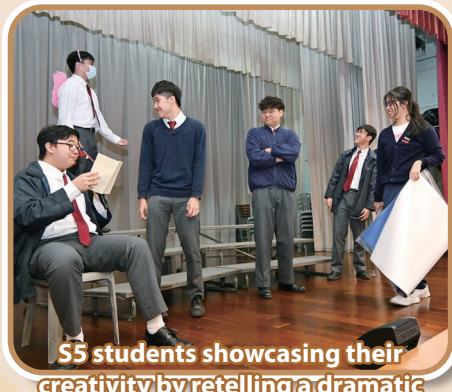
S5 students showcasing their creativity by retelling a dramatic scene from a story

From March 3 to 16, the English Department hosted English Fortnight under the theme "Read More, Soar Higher!" Lower-form highlights included an S1 Reading Competition, an S2 Drama Viewing of Taming the Dragon at the Sai Wan Ho Civic Centre, and an S3 Quiz Show. Senior students also thrived