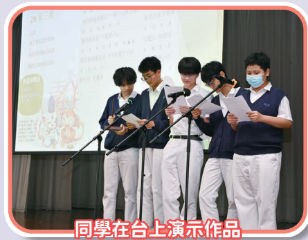
同學在台上演示作品

是次比賽邀請了吳汝興校友及梁錦堂校友擔任評判。兩位校友細心聆聽同學的作品，並從內容、節奏及押韻等方面給予具體意見，同時肯定同學積極參與的態度。參賽作品內容正面，既有對毒品的警惕，亦展現粵語音律特色。透過是次比賽，同學加深對粵劇白欖的認識，亦強化了抗毒意識。