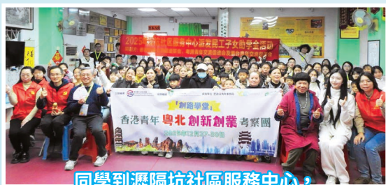
同學到瀝隔坑社區服務中心， 與民工家庭互動，並派發助學金