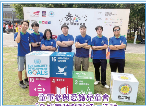
童軍參與愛護兒童會「全城舞動創彩虹」活動