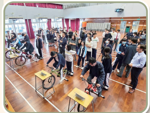
同學拼盡全力，堅持到底