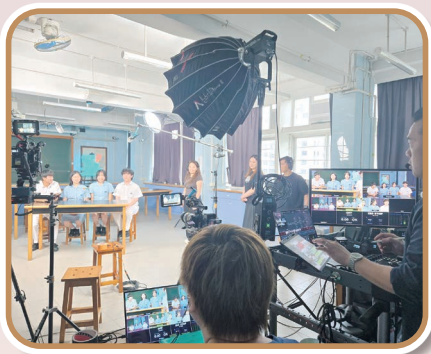
同學以生動有趣的形式介紹《潮平岸闊——高錕自述》一書